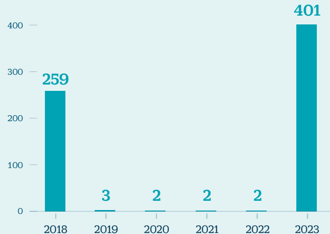
Calendario de vencimientos de deuda de NH En millones de euros