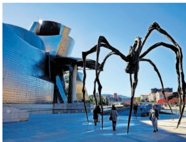
La obra Mamá , de Louise Bourgeois, es una de las muchas que envuelven el Museo Guggenheim.

El protagonista del cambio El Guggenheim es emblema e icono del nuevo Bilbao. Lo es desde hace 25 años, cuando el proyecto del arquitecto Frank Gehry veía la luz para agitar desde la margen izquierda de la ría toda Bizkaia a golpe de arte y de vanguardia. Para celebrar el aniversario, se