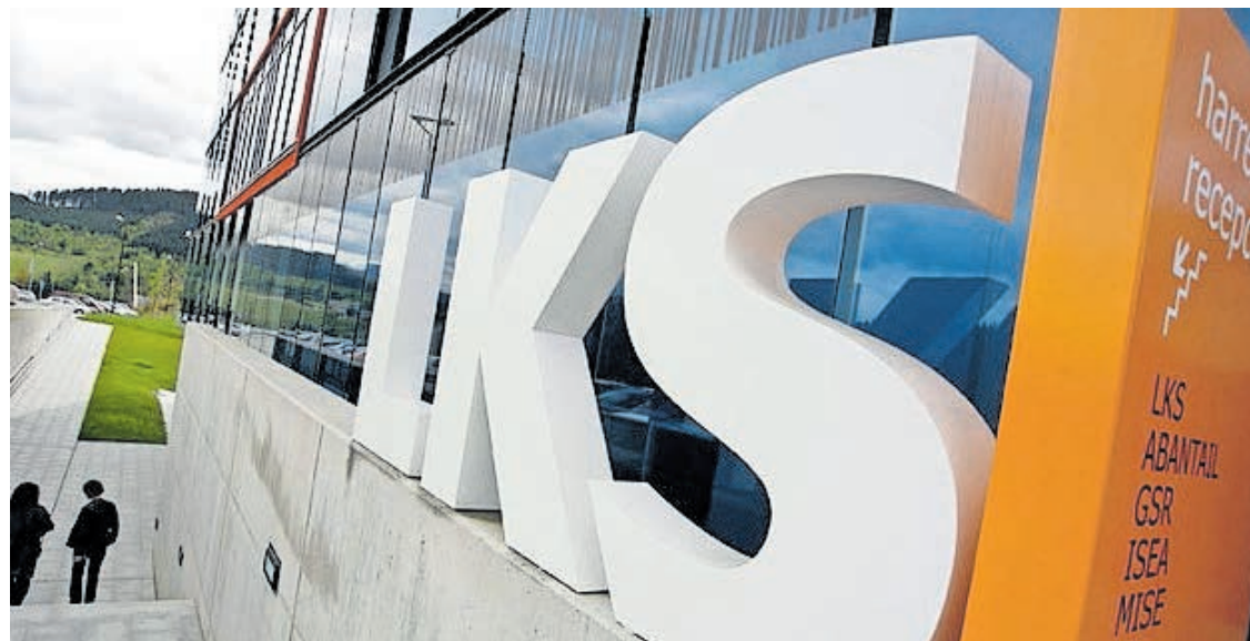
Sede de LKS Next en Arrasate, Gipuzkoa.

Todo ello en un proceso de innovación continua, aplicando procesos, tecnología y conocimientos financieros y legales con el objetivo de hacer a las organizaciones más eficaces sostenibles y resilientes en el tiempo.