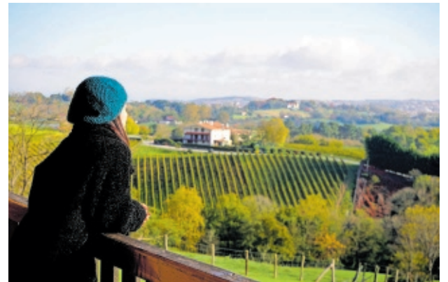
Basa Lore, un caserío situado en Hondarribia.