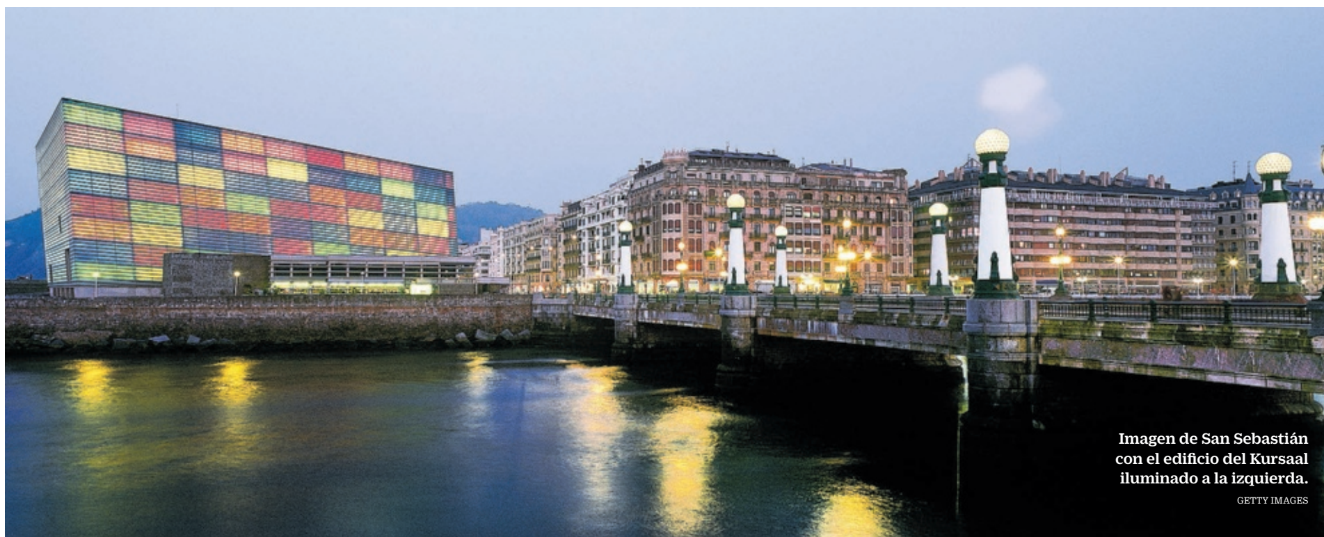
Imagen de San Sebastián con el edificio del Kursaal iluminado a la izquierda.