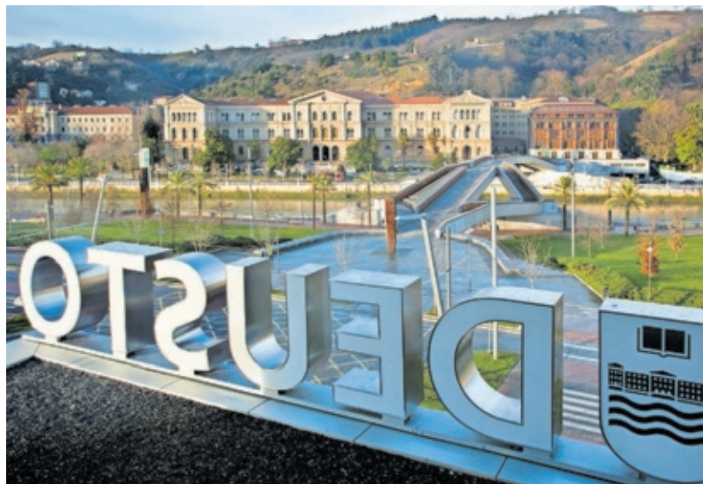
Campus de la Universidad de Deusto en Bilbao.