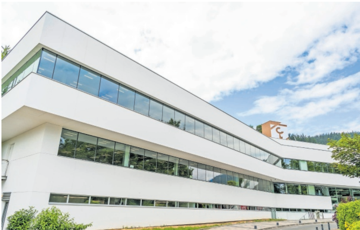
Sede central de Laboral Kutxa, en Arrasate-Mondragón (Gipuzkoa).