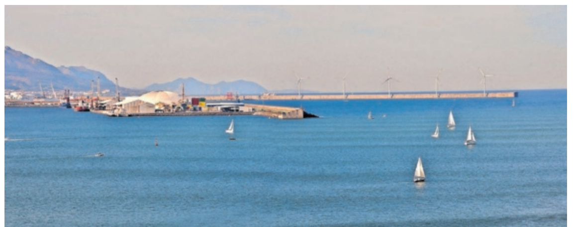
Vista del puerto de Bilbao.

La sostenibilidad social, económica y medioambiental son tres pilares fundamentales para el futuro de las empresas. Son elementos claves para su crecimiento responsable y, a su vez, un nicho de oportunidades. Por ello, queremos contribuir, en la medida de lo posible, a ese desarrollo sostenible".