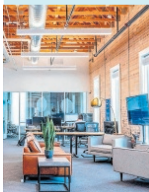
Interior del edificio.

Fundadores. Tienen fijada la posibilidad de deducirse el 35% del IRPF por inversiones en el sector de tecnologías.