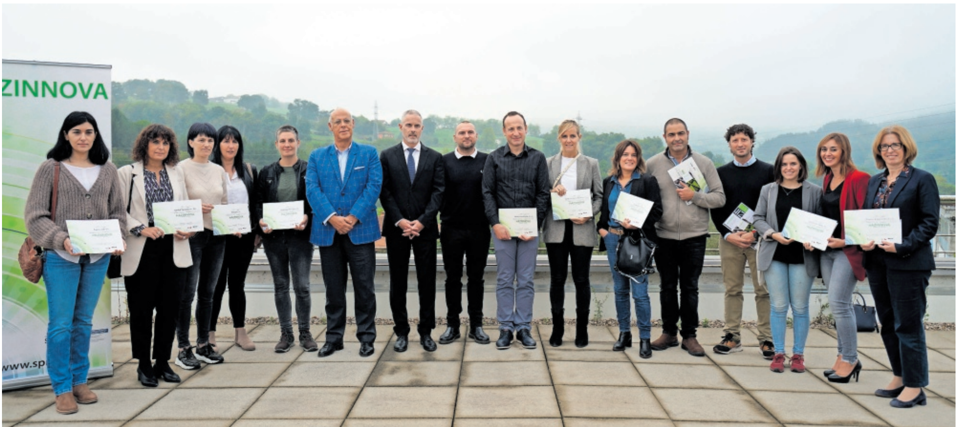
Representantes de 33 empresas guipuzcoanas recientemente reconocidas como innovadoras por el Gobierno vasco, Grupo Spri e Innobasque.