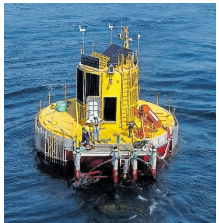
Imagen del nuevo laboratorio flotante HarshLab de Tecnalia.

Con estos equipamientos, se podrá evaluar en el entorno controlado de un laboratorio qué les sucede a los materiales, componentes y equipos cuando estos permanecen en el fondo marino