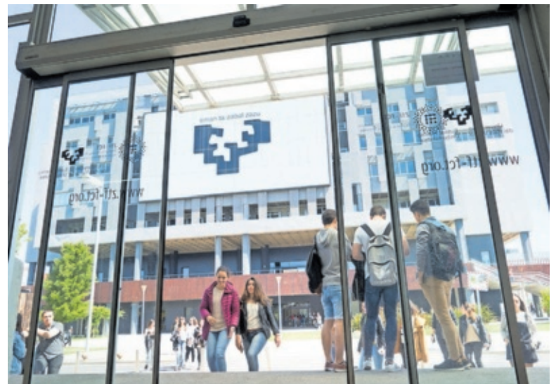
Estudiantes en la Universidad del País Vasco.