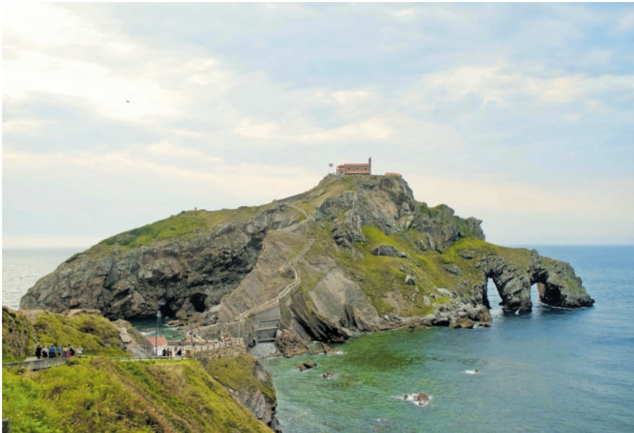
La ermita de San Juan de Gaztelugatxe, en Bizkaia, es uno de los escenarios de La casa del dragón .