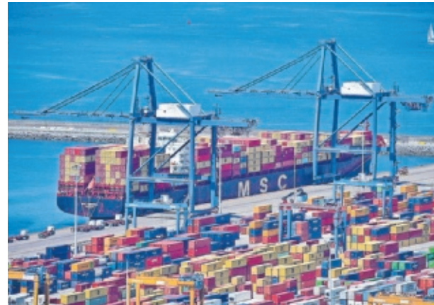
Terminal de contenedores del puerto de Bilbao.