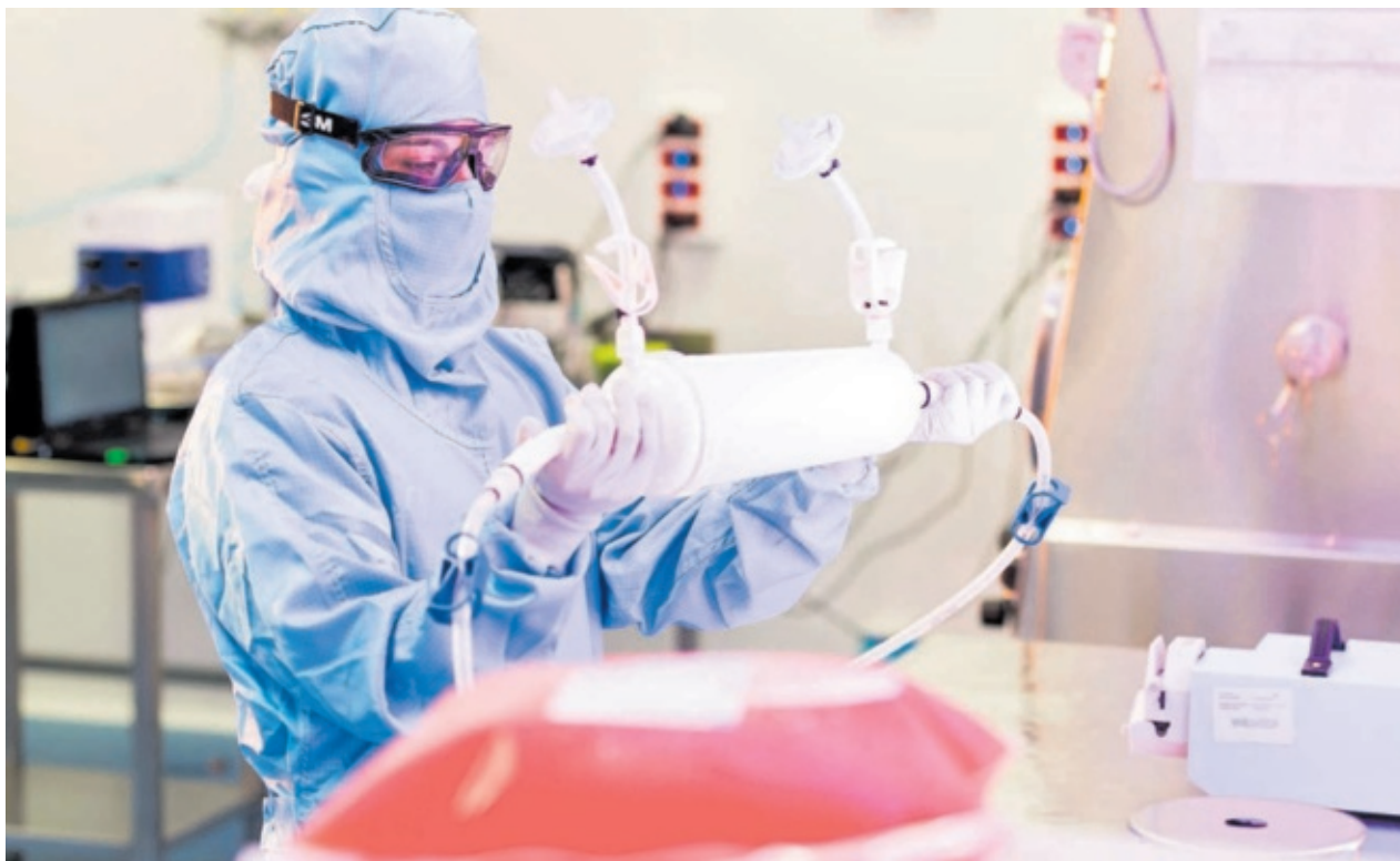
Instalaciones de VIVEbiotech, una firma biotecnológica fabricante de vectores virales con sede en Donostia.