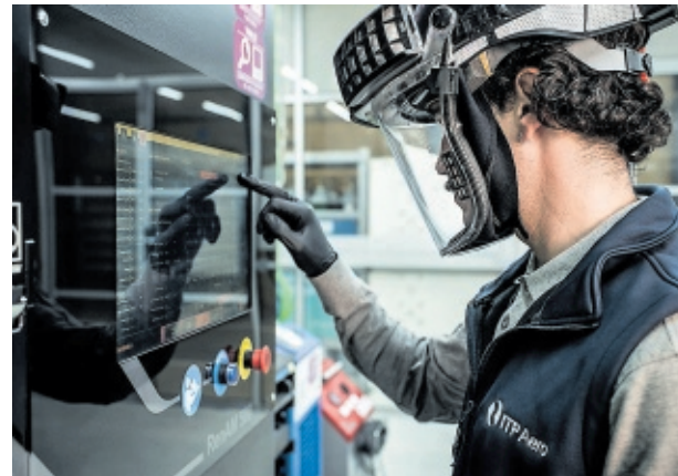
Un técnico de ITP Aero en la planta de Zamudio.

Menos resentida se vio la unidad de defensa del grupo, que participa en proyectos estratégicos con los principales consorcios