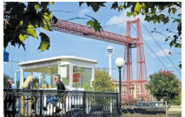
Terraza del hotel Puente Colgante en Portugalete.