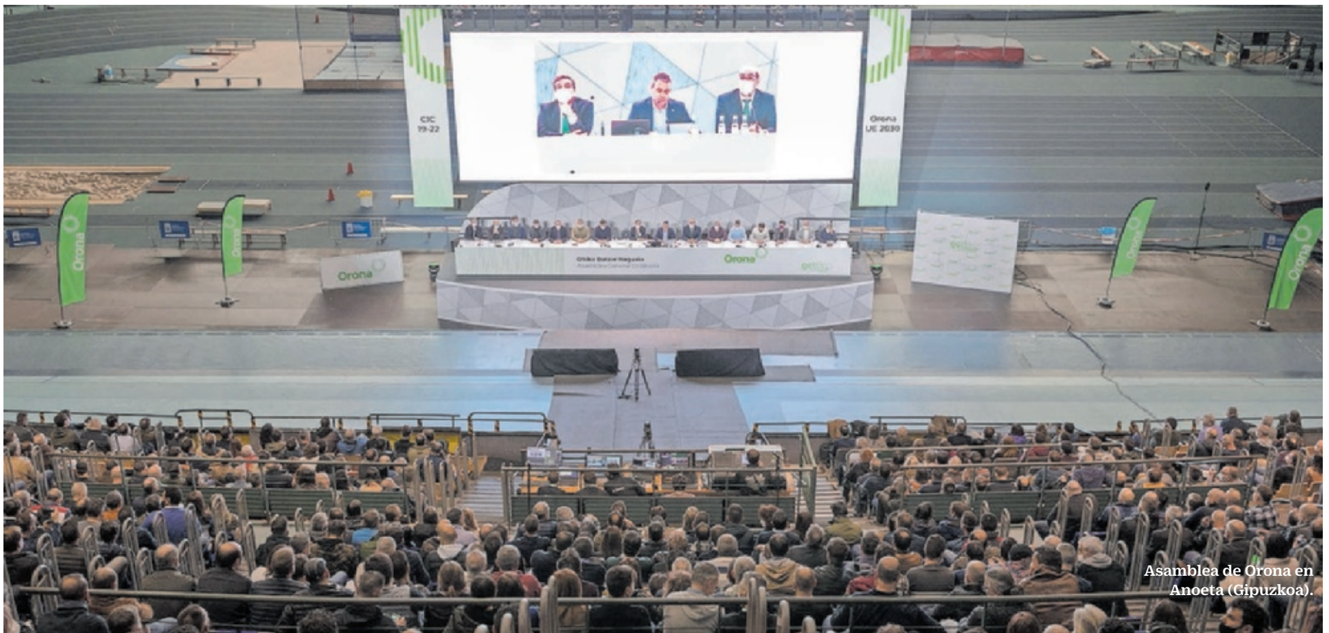
Asamblea de Orona en Anoeta (Gipuzkoa).