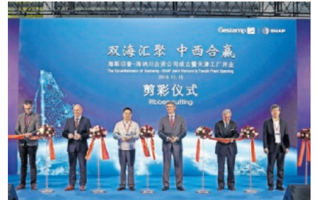
Inauguración de la fábrica de Gestamp en Tianjin (China).

Un fondo conjunto que suma 100 millones de eu-